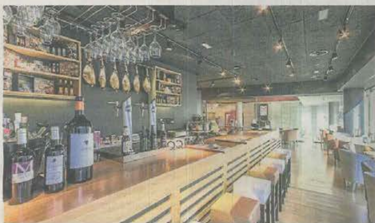
MAS Q MENOS ARAGONIA Local de la cadena de restauración de productos ibéricos.