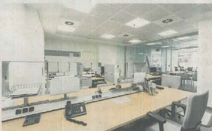
DKV LOGROÑO Oficinas de DKV, grupo al que Seventy Eight ha desarrollado una decena de obras.