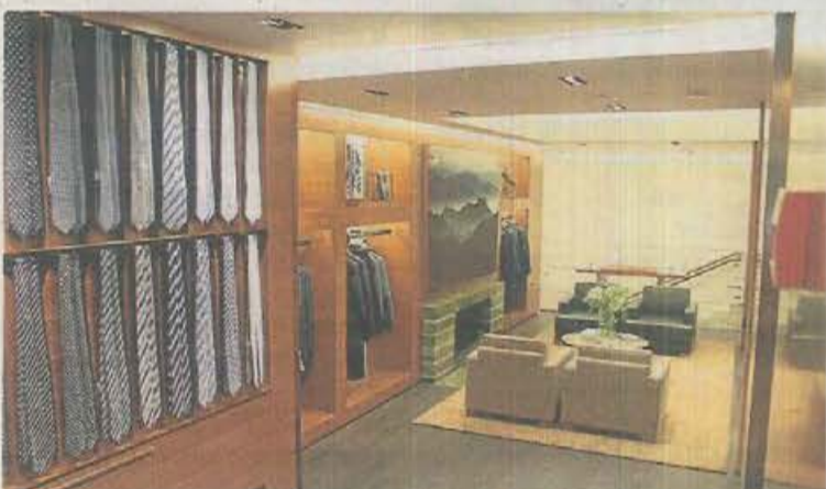
Ermenegildo Zegna BARCELONA Tienda de lujo del paseo de Gracia, una de las obras más emblemáticas de Seventy Eight.