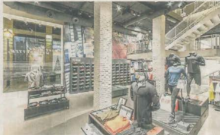
NikeStore MADRID Situada en Gran Vía, es una de las dos tiendas realizadas en la capital para esta marca deportiva.