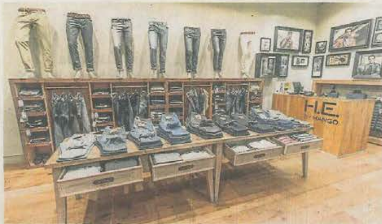
H.I.E. BY MANGO PUERTO VENECIA Tienda de la firma He, del grupo Mango, al que realizado dos tiendas en Milán, entre otras.