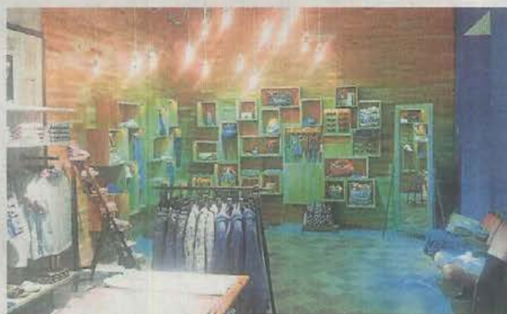
Pepe Jeans PARÍS Tienda ubicada en el centro comercial Carré Sénart, uno de los múltiples proyectos en el exterior.